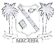
TABELA REFERENCIAL DE PREÇOS