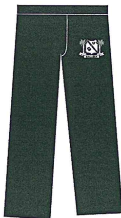
Figura 3: Calça

Calça Comprida para crianças e jovens de 6 aos 17 anos ou mais, em TACTEL 100% POLIESTER, Gramatura 170 G/M 2 , Tecido com aplicação de ANTI PEELING (bolinhas), na cor azul marinho, na cintura 4 (quatro) costuras com cós