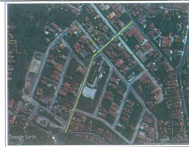
PLANTA DE LOCALIZAÇÃO Sem Escala