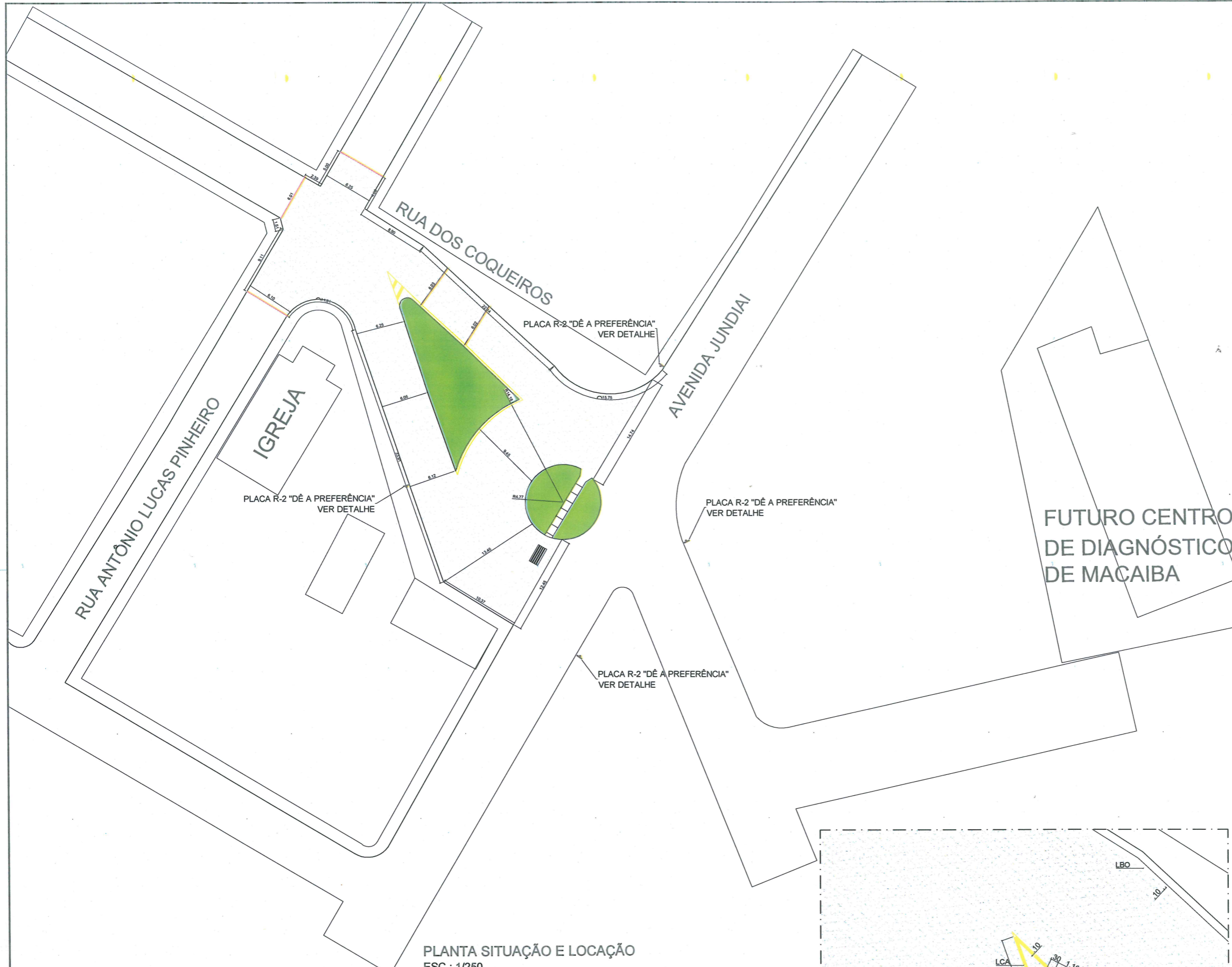
PLANTA SITUAÇÃO E LOCAÇÃO ESC.: 1/250