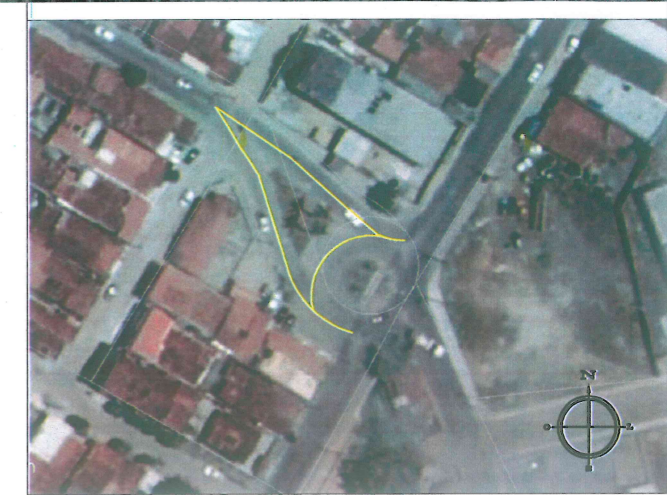
PLANTA DE LOCALIZAÇÃO Sem Escala