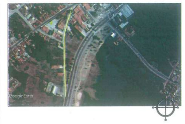
PLANTA DE LOCALIZAÇÃO Sem Escala