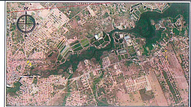
PLANTA DE LOCALIZAÇÃO Sem Escala