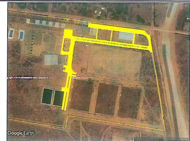
3 IMAGEM DE LOCALIZAÇÃO SEM ESCALA