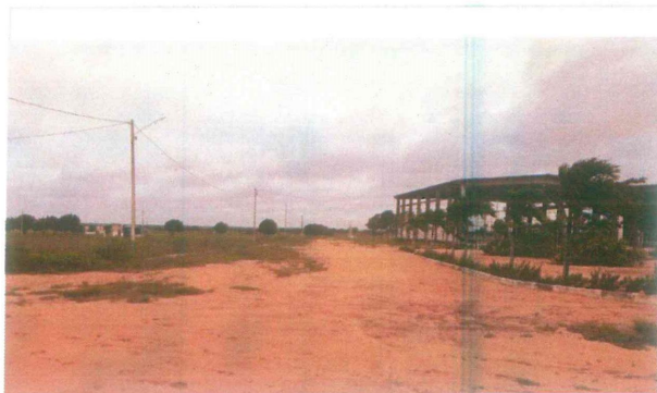
Arruamento a ser pavimentado-Acesso aos campos

SETOR: Engenharia Nº do Proc. 2001 Grau de Sigilo #PÚBLICO Mat 1116570-1