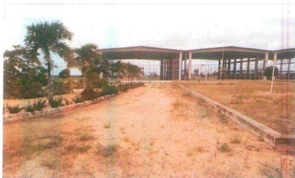
Arruamento a ser pavimentado-espaco entre quadras