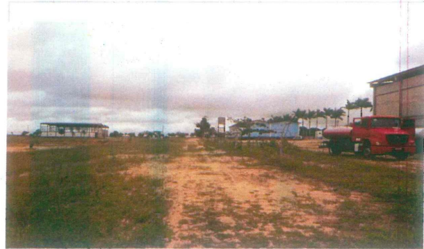
Vista geral de arruamento interno onde será