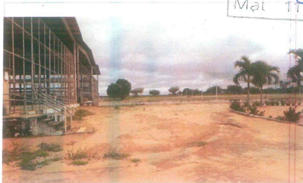
Arruamento a ser pavimentado-Acesso as quadras