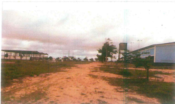
Arruamento interno que será pavimentado