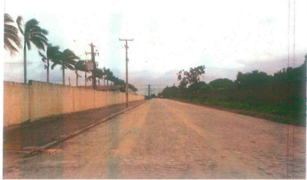
Vista da rua principal de acesso a Vila Olímpica