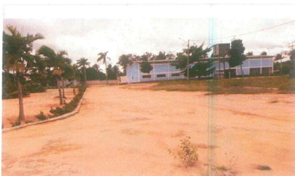
Vista geral de arruamento a ser pavimentado