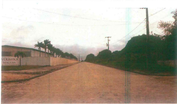
Acesso principal a Vila Olímpica