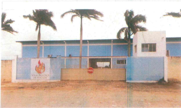
Portão de entrada da Vila Olímpica