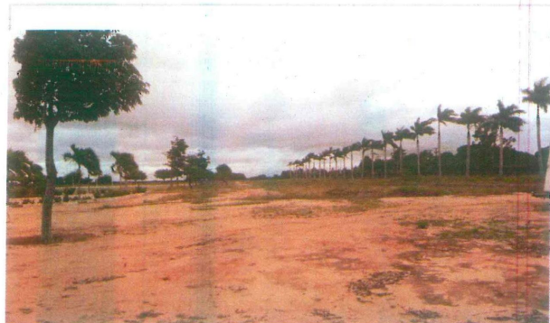
Arruamento a ser pavimentado-Acesso as quadras de