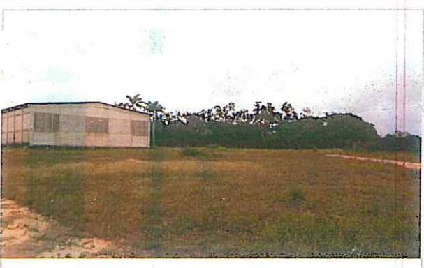
Área para implantação das instalações do Alojamento