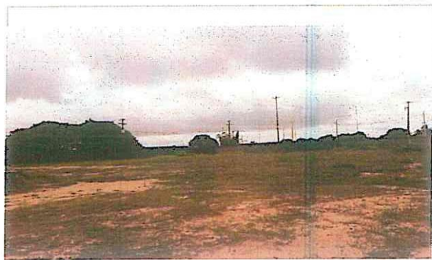
Vista geral da área de implantação do Alojamento

SETOR :Engenharia Nº do Proc. _____ Grau de Sigilo _____ #PÚBLICO _____ Mat 1116578-1