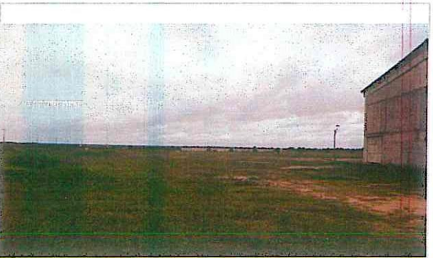
Vista geral da área de implantação do Alojamento