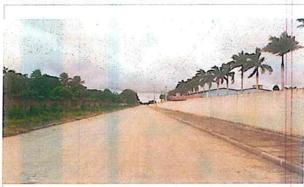
Vista da infra estrutura existente no acesso a Vila