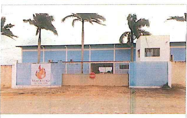
Guarita de entrada as instalações da Vila Olímpica