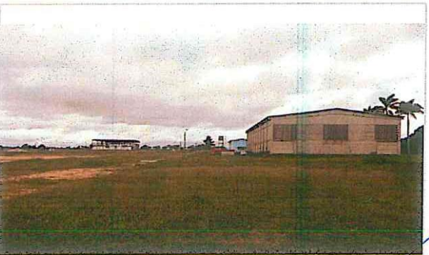
Vista geral da área de implantação do Alojamento