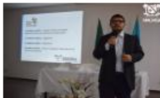
PROJETOS ESPECIAIS | 19 NOVEMBRO, 2019 Plano Diretor: Segunda audiência pública acontece em 10 de dezembro