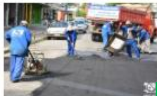
ADMINISTRAÇÃO | 13 NOVEMBRO, 2019 Prefeitura recebe nova emenda e visa recapeamento de várias ruas do centro