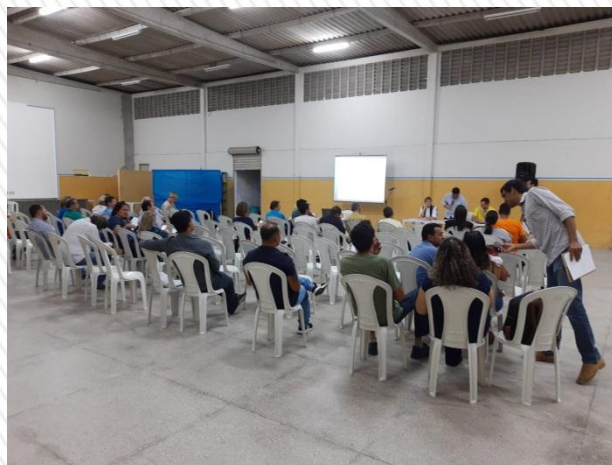
Foto 03 - Equipe técnica respondendo duvidas dos participantes