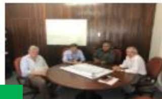
PREFEITURA | 06 NOVEMBRO, 2019 Feito vai ao DNIT para tratar de conclusão da BR-304 e das obras